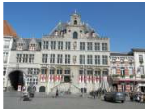
(Radnice v Bergenu op Zoom)

Několik desítek let zrála myšlenka doplnit zdejší Památník padlých prstí z hrobu plukovníka Hrdiny, který se nachází v přímořském městě Bergen op Zomm v nizozemském království. Po nezbytných přípravách a konzultacích s nizozemskými úřady se vyvednutí prstě konečně uskutečnilo v sobotu 18. dubna.