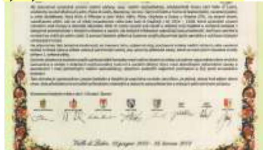
České znění Dohody o partnerství ze dne 28. června 2008.