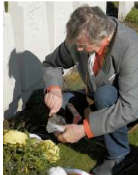
(Starosta ukládá prst z hrobu do schránky.)

Několik desítek let zrála myšlenka doplnit zdejší Památník padlých prstí z hrobu plukovníka Hrdiny, který se nachází v přímořském městě Bergen op Zomm v nizozemském království. Po nezbytných přípravách a konzultacích s nizozemskými úřady se vyvednutí prstě konečně uskutečnilo v sobotu 18. dubna.