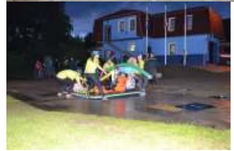
(Snímek z Noční soutěže)