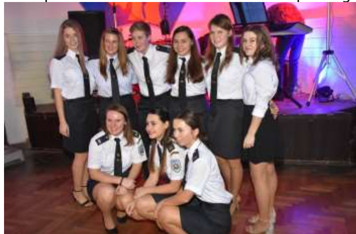
Soutěžní družstvo žen SDH Ploukonice

První pátek v letošním roce proběhla výroční valná hromada SDH Ploukonice. Postupně byly přečteny jednotlivé zprávy. Začal kronikář, který v krátkosti připomenul historii sboru. Následovala zpráva soutěžního družstva žen, která byla doplněna o fotografie z průběhu sezóny. Děvčata se v roce 2019 zúčastnila 32 soutěží, mezi které patřilo okresní a krajské kolo v požárním sportu, soutěže Podkozákovské ligy, Jizerské ligy, FIRE NIGHT CUPU a odzkoušela si i Extraligu ČR. V několika soutěžích vystoupily i na stupně vítězů. V zimní pauze děvčata zlepšují fyziku a pravidelně dochází na spinning.