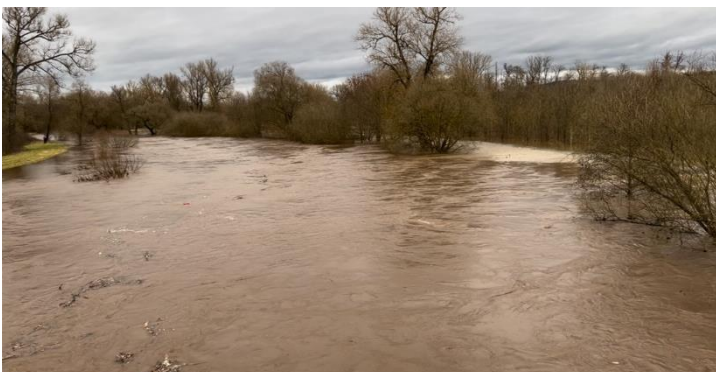
25. prosince 2024 foto Jizery z mostu proti proudu

Z 24. na 25. prosince se přivalila velká voda, která v takovémto rozsahu nebyla v Ploukonicích minimálně 10 let, nejvíce to zasáhlo dům č.p. 38, kde došlo k zatopení spodní části, odkud se musela vystěhovat všechna zvířata. Voda zasáhla i sportovní areál, který byl kompletně zatopen a místy bylo i více než 40 cm vody. Sportovní plocha, která byla vybudovaná v loňském roce tak prošla těžkou zkouškou, kterou úspěšně ustála.