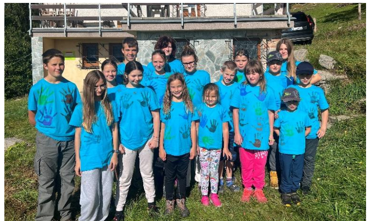
Soustředění dětí v Horním Tanvaldu

Děti absolvovaly seriál dětských soutěží s názvem Dětský superpohár 2023, soutěž ve Březině, mladší děti 3. místo a starší 8. místo. Svijany, mladší děti 8. místo a starší 5. místo. Ploukonice, družstvo mladších s označením A 8. místo a družstvo B šlo mimo soutěž, starší děti 6. místo. Olešnice družstvo mladších dětí, 6. místo. V Sezemicích mladší i starší děti obsadily shodně 8. místo. Dneboh, mladší děti družstvo A 7. místo a družstvo B 9. místo, starší děti 5. místo. Na podzim děti vyrazily na soustředění, které se uskutečnilo první říjnový víkend na chatě ZD Sever Loukovec v Horním Tanvaldu.