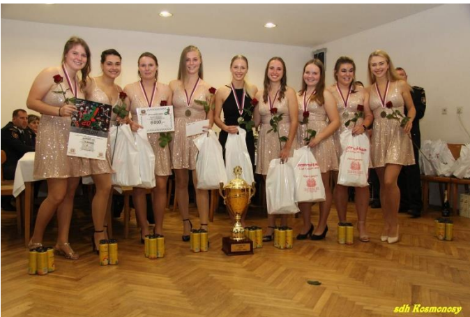
Vyhlášení Jizerské ligy 2023