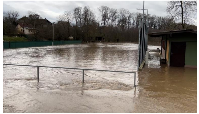
Sportovní areál Ploukonic 25. prosince 2023

Velká voda nebyla v Ploukonicích dlouho, ale letošní zimu to stihla hned dvakrát.