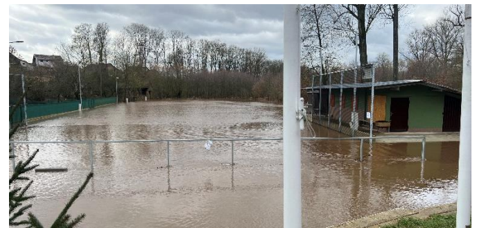
Velká voda 5. února 2024, Ploukonic - sportovní areál

Velká voda nebyla v Ploukonicích dlouho, ale letošní zimu to stihla hned dvakrát.