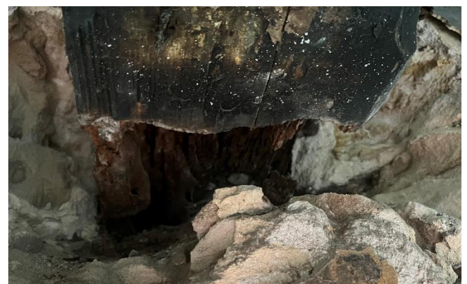
Poškození trámu, který nese podlahu knihovny

V budově OÚ se provádějí stavební úpravy, ve volební místnosti se dělají nové omítky, podlaha, zdroj vytápění a nový strop s osvětlením. Místnost se rozšíří o druhou místnost, která nebyla využívaná a sloužila jako skladiště.